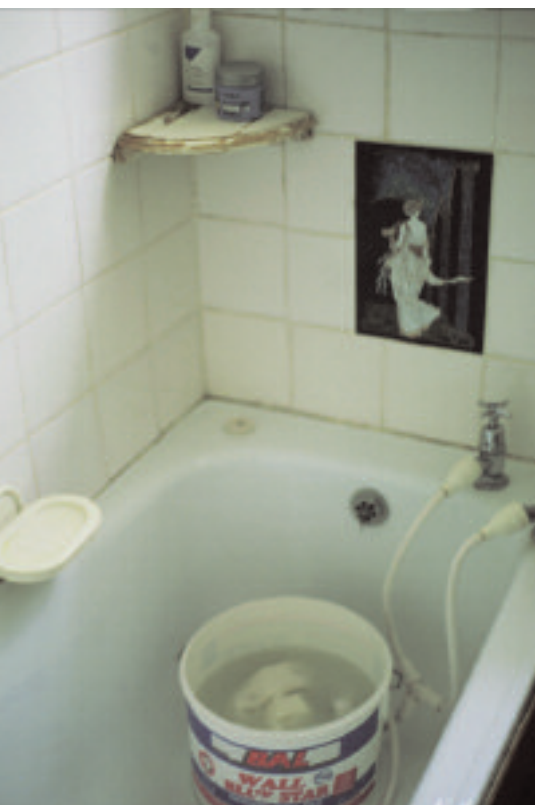
Broken 009 Broken 010