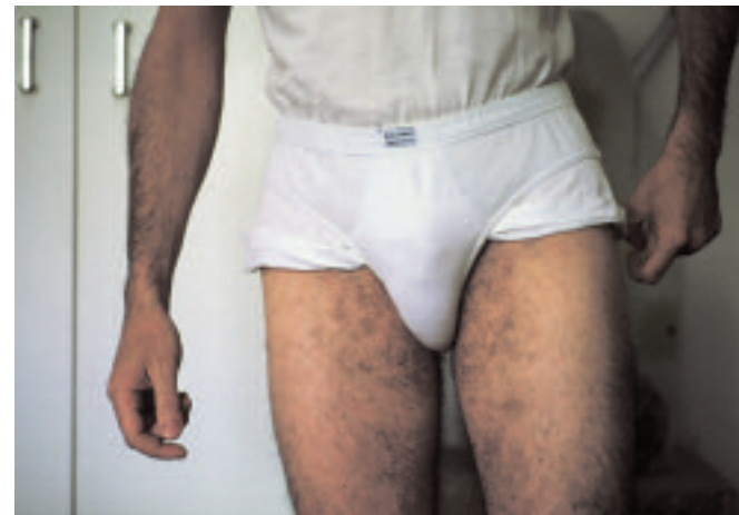
Broken 020 Broken 022

E. caeu tan profundo que todas as súas rutas de escape e portas traseiras quedaron tapiadas. Tanto que esa ostentosa provisionalidade en que intentaba vivir, para enganarse cunha pronta partida, rematou nunha estable perennidade, encouzando o seu ámbito e deixando sen folgos o que o rodeaba.