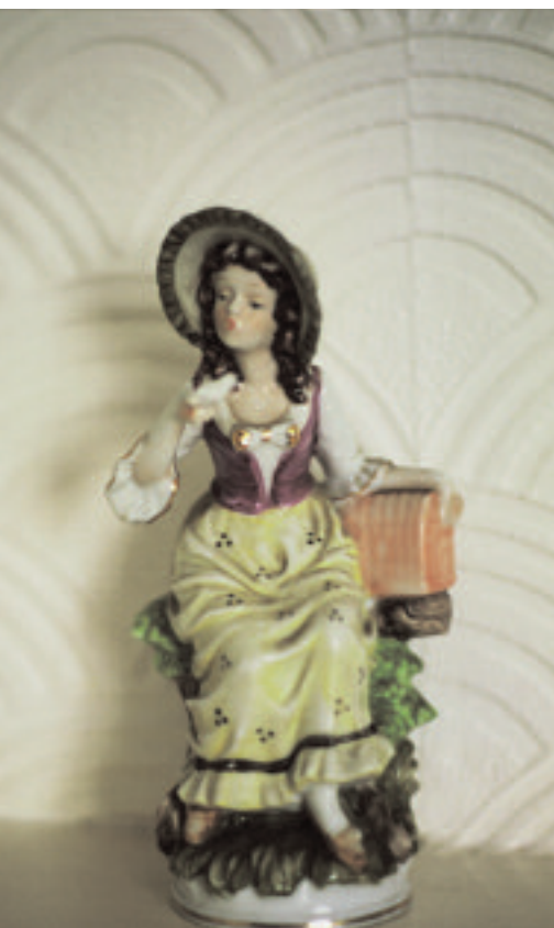
Broken 014 Broken 015