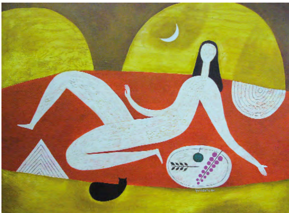
Nu con gato Acrílico sobre táboa 120 x 90 cm 2010