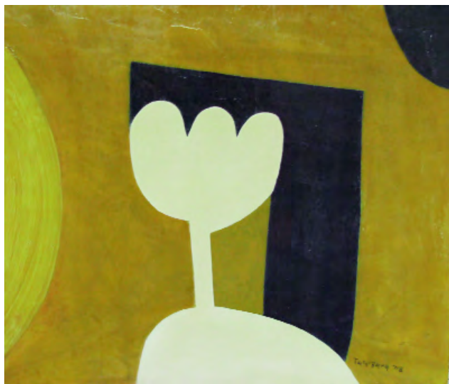
Flor branca Acrílico sobre táboa 55 x 46 cm 2007