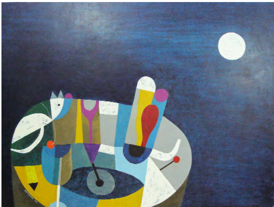
Terra e lua Acrílico sobre táboa 120 x 90 cm 2009