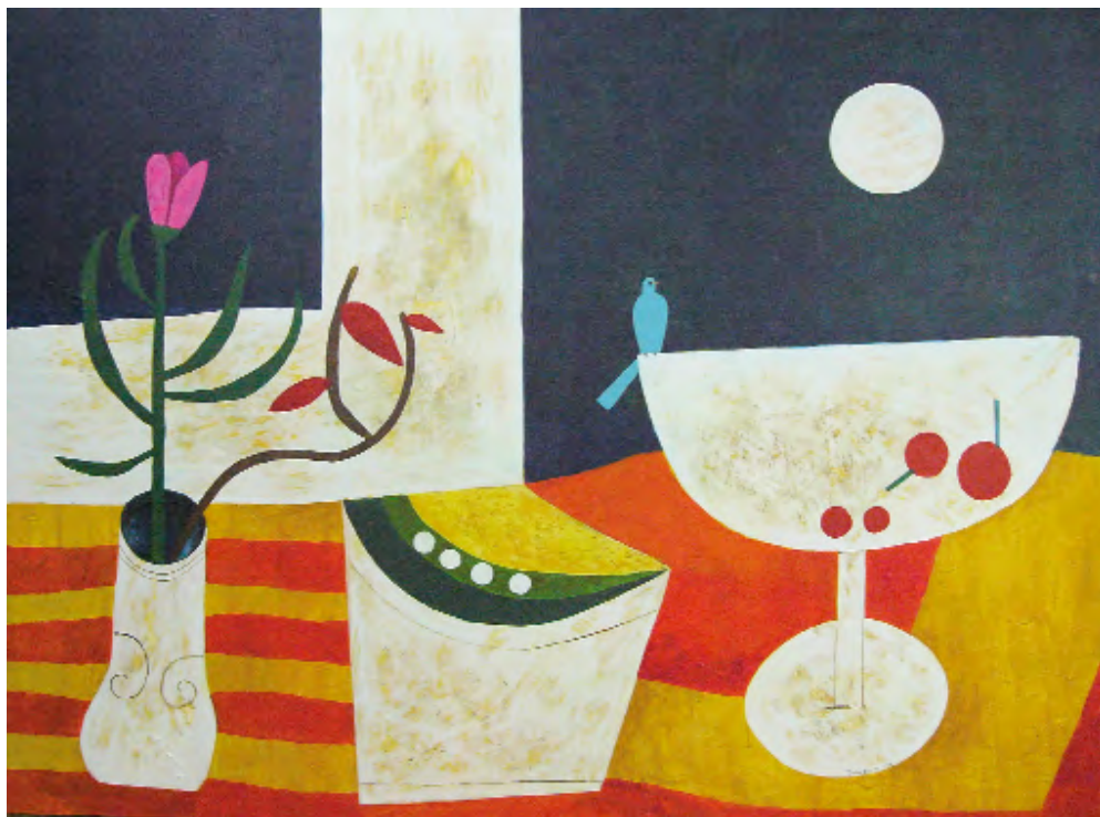
Bodegón con paxaro azul Acrílico sobre táboa 120 x 90 cm 2009