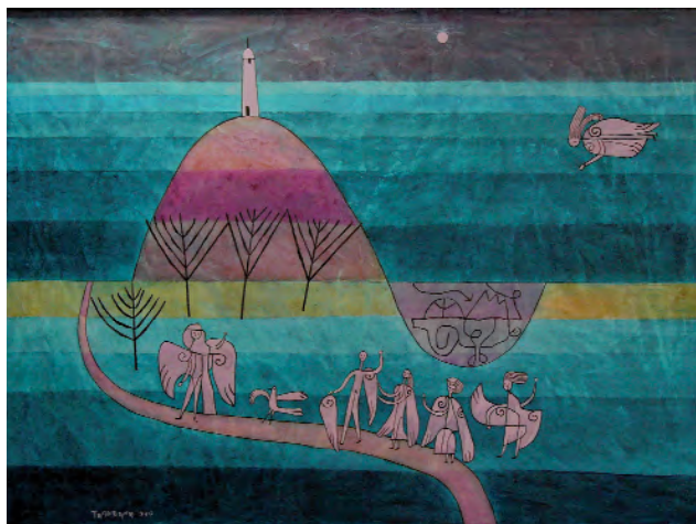
Home que recibiu ás Acrílico sobre táboa 120 x 90 cm 2007