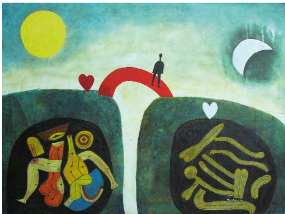
Ponte vermella Acrílico sobre táboa 120 x 90 cm 2010