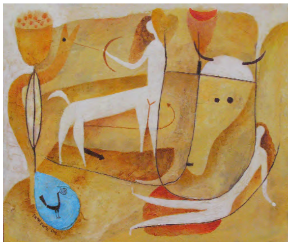
Touro e muller Acrílico sobre táboa 55 x 46 cm 2007