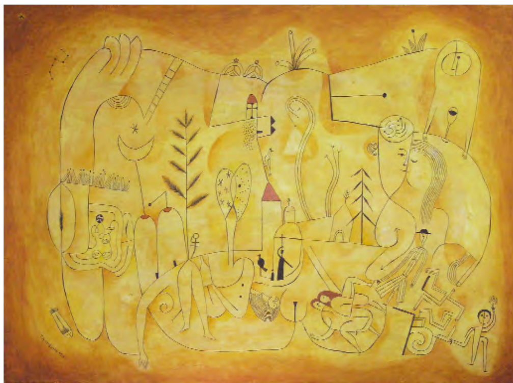
O mundo e más eu Acrílico sobre táboa 120 x 90 cm 2007