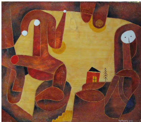
Paisaxe en cor cobre Acrílico sobre táboa 55 x 46 cm 2007