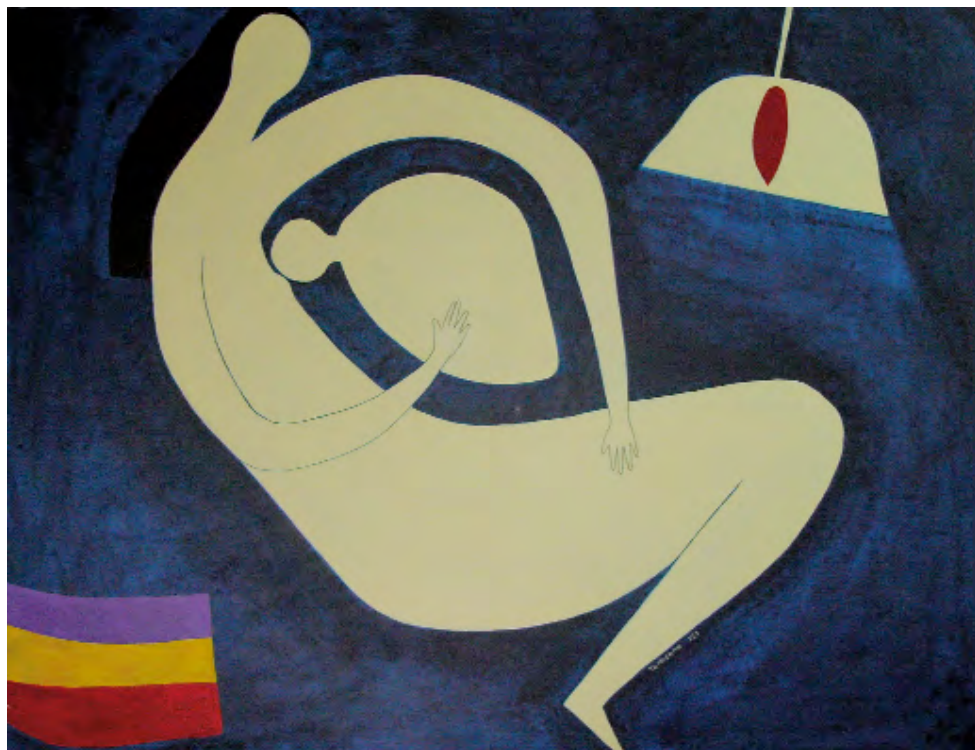
Maternidade Acrílico sobre táboa 120 x 90 cm 2007